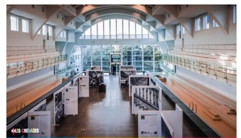
La Cité Miroir